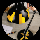
MÉTAL BRUT OU POREUX