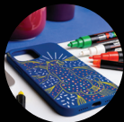
PLASTIQUE TYPE SILICONE